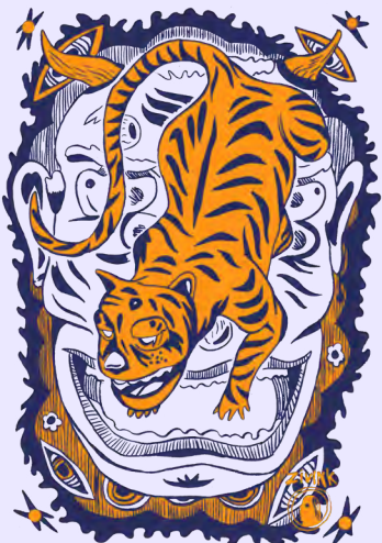
זיו שמח | Untitled

עלות השתתפות: 1,100 ש"ח בהרשמה מוקדמת: 990 ש"ח