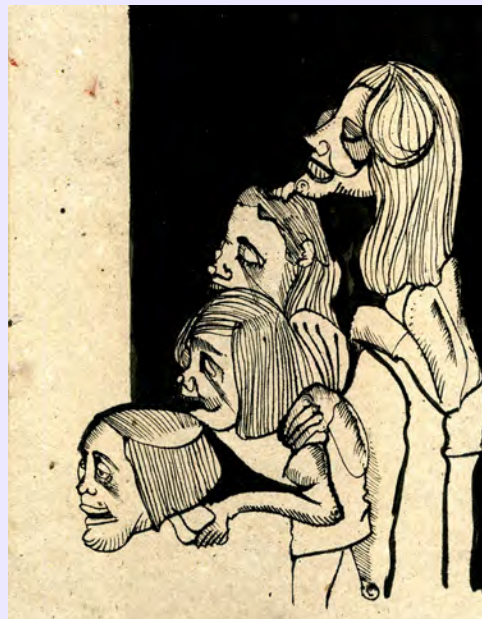
זיו שמח | Suicide Girls